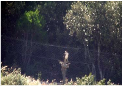
Bonelli adulte dans une placette destinée au vautour percnoptère