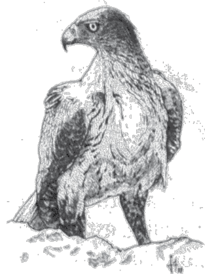
Dessin : Jérôme Maire

Conservation de l'aigle de Bonelli dans le sud méditerranéen de la France